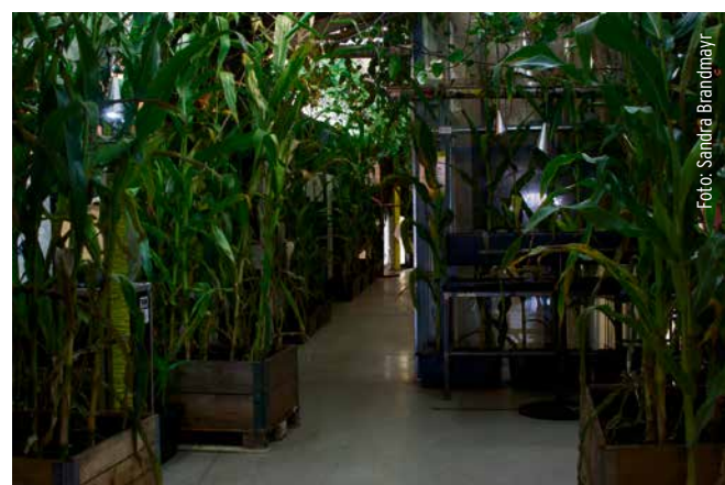
»Nature monotonía« in the entrance area of Stadtwerkstatt

Somehow, the idea of planting corn came again when we started to work with the idea of 'more or less', 'Stadtwerkstatt more or less'. We liked this idea of having this image of monotonía, of nature-culture monotonía, as cornfields are very wide, but also very industrial and monotonous. It's one of the first cultured plants, and we did a lot of research about the history of corn, it's also a migrating plant that has traveled all over the world. And we very much liked the idea to have nature in the house, but not the wild and romantic one, the very monotonous one, the very exploited one. That was the main idea, and when we told our community about it, everybody said 'Oh cornfields, my childhood! I went through the corn, and heard the wind, etc.' So it's also very emotional for everyone, and that has really surprised me. You lose yourself in a cornfield, it's totally disorientating, when you are in the middle, when you have to decide which way to go, you have to keep straight ahead, otherwise you never get out of it! (laughs)