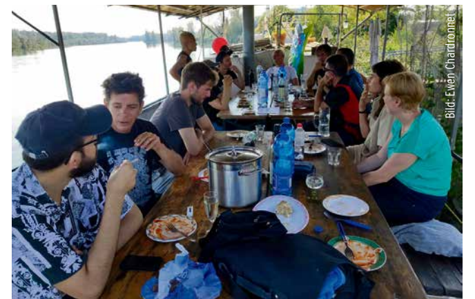
Gathering on Eleonore boat during the 48h.

netic fields nearby. Using a WSPR beacon that I made, we're reaching Australia, New Zealand with 0.5v. It's a 40m band, 7 MHz. We're also in contact with the Stubnitz on a very small band, the bandwidth is 6 Hz. We also transmit through a standard satellite TV dish.