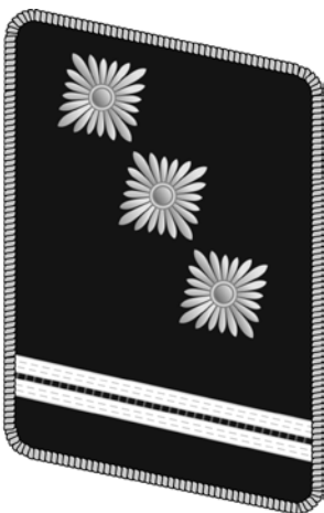
Insignien des Widerstands? Dienstgradabzeichen eines SS-Obersturmführers