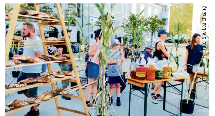
»Make Bread. Eat Pickle«