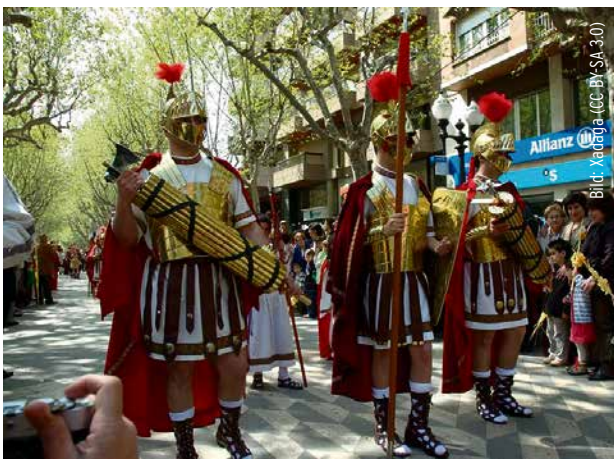
Zur Abwechslung neuer Wein in alten Schläuchen? Likören mit »fascisc« bei einer Prozession in Katalonien

Einer Übergangsphase von einem Zeitalter der liberalen Demokratie, die niemals umfassend verwirklicht wurde, in eines von unzähligen kleinen und großen Auseinandersetzungen zwischen ethnischen, kulturellen und religiösen Identitäten, die bewaffnet und ausgerüstet