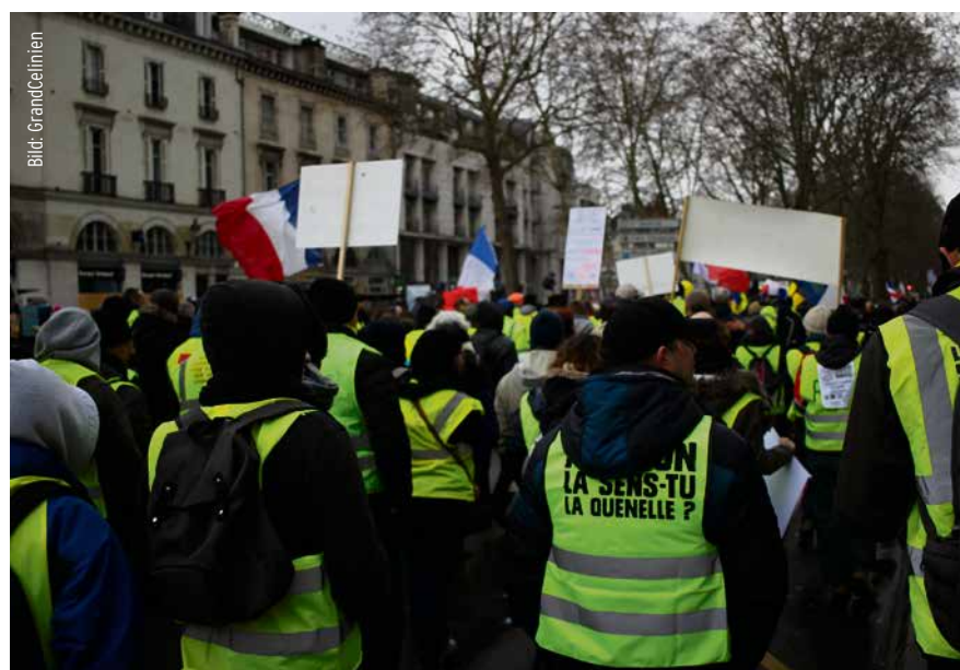
Gelbwesten-Proteste in Tours 2019

Während die Linkspopulisten in der angelsächsischen Welt ihre Kampagnen vorbereiteten, schuf die französische Gelbwesten-Bewegung im Herbst 2018 den Prototyp für einen neuen Kampfzyklus außerhalb der Bahnen institutionalisierter Politik. Die Gelbwesten begannen als eine