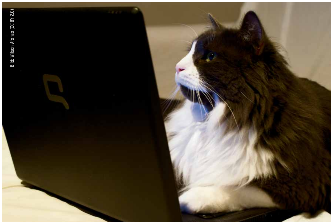
Feline Internet-Grundausrüstung auf der Suche nach Ablenkung vom Doomscrolling

verschwindet nicht durch Ignorieren. Andererseits trägt mittlerweile fast jeder ein Gerät mit sich herum, mit dem sich beispielsweise Fälle von Polizeigewalt und andere skandalöse Vorkommnisse dokumentieren und umgehend mit der Welt teilen lassen, wie es sie früher zwar auch schon gab, nur eben nicht vor den Augen der virtuellen Öffentlichkeit. Man könnte behaupten, dass das im sogenannten postfaktischen Zeitalter keinen Unterschied macht, etwa wenn ein Innenminister allen entgegengesetzten Belegen zum Trotz einfach weiß , dass die Polizei eine