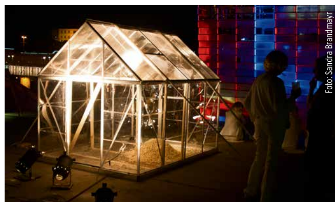
freundinnenkunst: Endless distribution of popcorn