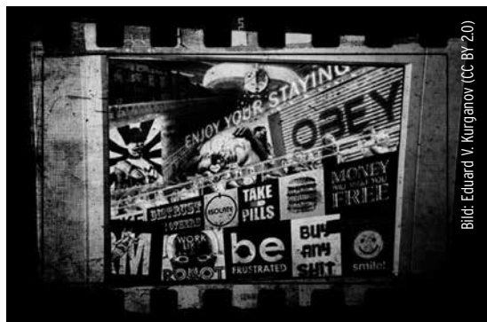
They Live, We Sleep - Artist Statement

Ist Corona ein Einschnitt? Eine Krise? Eine Zäsur? Viele Bezeichnungen werden bemüht, um die Wucht und Tragweite dessen zu benennen, was uns hier widerfährt. Ich plädiere für eine andere Perspektive: Vielmehr als dass uns Corona etwas »gibt« - Krankheit, Krise usw. -, nimmt es uns etwas weg: Illusionen. Es ist wie in der Parabel »Des Kaisers neue Kleider« und es ist höchste Zeit, dass alle anerkennen, dass der Kaiser nackt ist, dass also Corona auf gesellschaftlicher und sozialer - natürlich nicht auf individuell-gesundheitlicher - Ebene nichts »verursacht«, »hervorbringt«, »produziert« oder sonst wie aktiv hinzufügt, sondern wie eine Sehhilfe klarer zeigt, was Sache ist. Es ist wie in John Carpenters Film »Sie leben«, wo der Hauptdarsteller zufällig eine Brille findet, die ihn die gesellschaftliche Wahrheit erkennen lässt, nämlich, dass sich das ganze bunte Treiben nur um Ausbeutung und schnödes Funktionieren dreht.