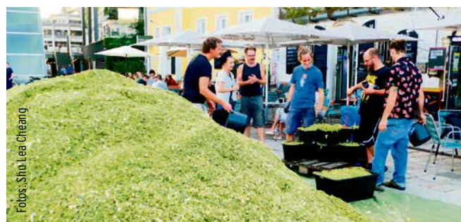
»48-Hours-Redistribution/Don't touch«, corn silage.

energy comes in. So that's a part of the whole connection. I made some reflections about this staging of material in earlier projects, the reflection of this year's context of the fermenting corn silage will follow.