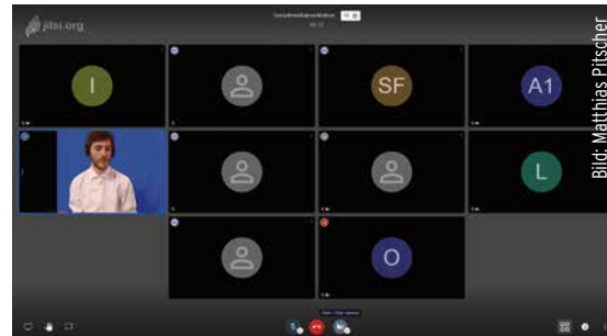
Social Media Meditation by Matthias Pitscher, at artwillsaveus 2020, group session streamed through Jitsi.org, April 17th, 2020

Considering the apparent impossibility of 'real' synchrony measured in