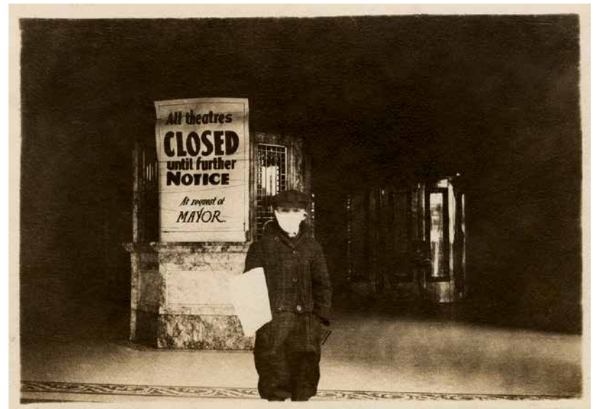
Geschlossenes Kino in Seattle während der Pandemie 1918

mediale Position ‚des Kinos‘ während des Covid-19-Lockdowns im vergangenen Frühling zu verorten sucht. Robnik adressiert hier nichts weniger als die paradoxe Situation des Kinos als eigentlich öffentlicher Rezeptionsraum, dessen bereits jahrzehntelang andauerndes Abrutschen in Richtung des Häuslich-Privaten sich 2020 in der zeitweisen Schließung der noch verbleibenden öffentlichen Spielstätten besonders eindrücklich