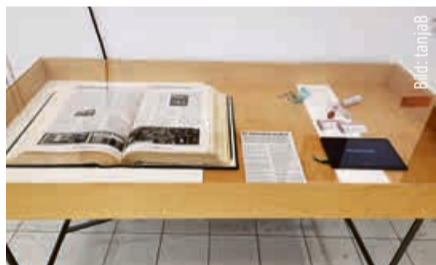
... und als Buch in der Vitrine.