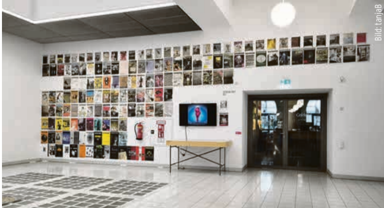
Die Versorgerin als affichierte Covers in der Kunstuni Linz...

auf STWST, Kunst, Medienkunst, linke Politik, Aktivismus und die gute alte »Transformation von Kunst und Gesellschaft«, aber auch größer gedacht in Richtung Stadtzeitung, inklusive Freie-Szene-Berichte,