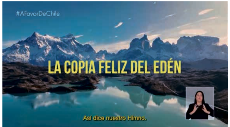
Screenshot eines Fernsehspots zur Kampagne für den zweiten Verfassungsentwurf (2023)

schockierende Äußerungen herbeigeführt wird, der Entzug von Rechten und die Kürzung sozialer Programme sind eine zermürbende Kanonade. Es geht darum, uns eine allgegenwärtige Gefahr spüren zu lassen, die jeden Reflex zum Aufbau von Gemeinschaft aushebelt; die Idee ist im Gegenteil sogar, die Verteidigung »unserer selbst« zu bevorzugen und dabei dasjenige austauschbar zu machen, wogegen wir uns immunisieren sollen: ausländische Invasion, Bedrohung durch Anderssein, woher es auch kommen mag - Einwanderer oder Mapuche -, Proteste oder »Wokismus« und all die kriminalisierbaren »Ismen« von Kast.