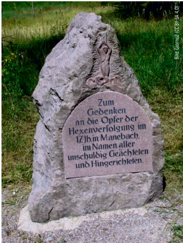
Denkmal für die Opfer der Hexenverfolgung in Manebach/Thüringen

Magnus Klaue war von 2011 bis 2015 Redakteur im Dossier- und Lektoratsressort der Jungle World und von 2015 bis 2020 Wissenschaftlicher Mitarbeiter am Simon-Dubnow-Institut für jüdische Geschichte und Kultur in Leipzig. Von Magnus Klaue ist 2022 im XS-Verlag der zweite und abschließende Band der Essaysammlung »Die Antiquiertheit des Sexus« erschienen. Seit Frühjahr 2024 ist er Mitherausgeber der Halbjahreszeitschrift »casablanca. Texte zur falschen Zeit«. https://textezurfalschenzeit.de/