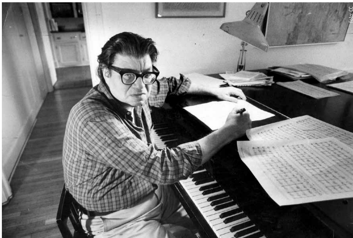
Morton Feldman am Klavier

Wiederholt arbeitete Feldman in seinen frühen Stücken mit dem Faktor der Unbestimmtheit (Indeterminacy), um so den Klang von traditionellen musikalischen Strukturen und der Kontrolle des Komponisten zu befreien, wie es sich etwa an der graphischen Notation exemplifizieren lässt, die er erstmals für sein Cellostück Projection 1 (1950) entwickelte. Hier werden keine exakten Tonhöhen und -dauern angegeben, diese Entscheidungen legt Feldman in die Hände der Interpreten. Der Komponist setzt den Rahmen, der aber nicht im herkömmlichen Sinn als fester Notentext ausformuliert ist, sondern intellektuell erarbeitet