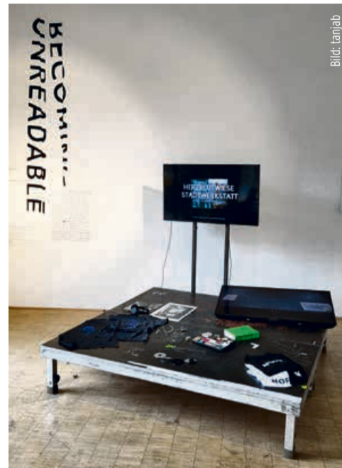
Die Herzblutwiese als Installation bei AMRO 2026 »Becoming Unreadable«