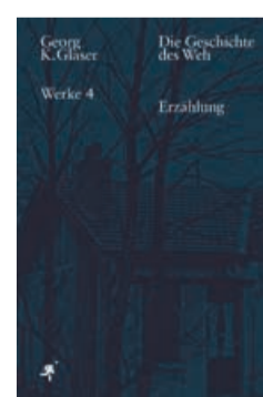
Georg K. Glaser: Die Geschichte des Weh. Erzählung, 2023, 224 Seiten, ça ira-Verlag Freiburg