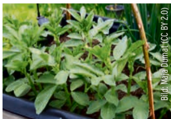
Minimum-Zehrer & Maximum-Rock'n'Roll: Die Ackerbohne.

haben wir uns in einem langen wie schmerzhaften Prozess der Selbstfindung befreit, traten den Gang in unsere Innerlichkeit an und fanden die wärmenden, sonnengetränkten Wogen des inneren Seins.