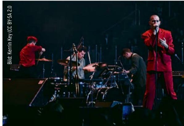
Shortparis bei einem Auftritt 2019